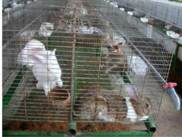
Chuồng sử dụng hệ thống uống tự động