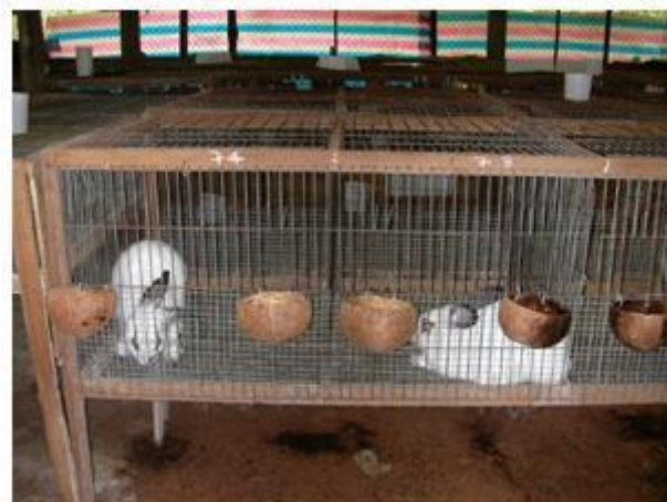
Chuồng nuôi thỏ