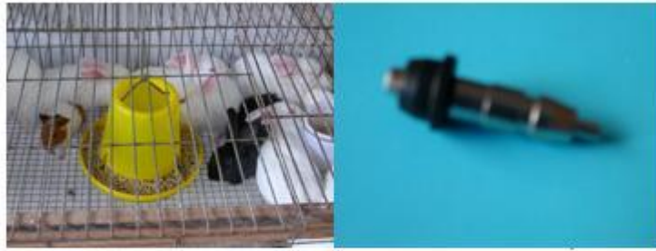
H1: Máng thức ăn tinh; H2: Núm uống