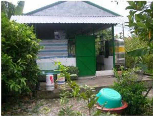
Mô hình chuồng nuôi thỏ