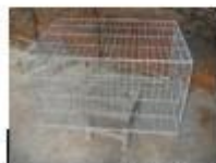
Lồng nuôi cá thể