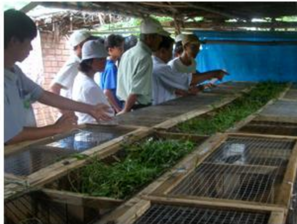
Máng thức ăn xanh ở giữa 2 ô lồng