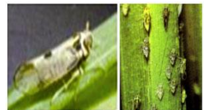
Rầy lưng trắng trưởng thành Rầy cám RLT ở góc lúa

Gây hại cùng với rầy nâu nhưng trong cùng lúa thì rầy lưng trắng phát sinh rộ sớm hơn. Rầy non có màu trắng hoặc nền trắng cùng các vết xám đậm. Thường hại nặng trên các giống lúa nhiễm rầy, lúa lai, thâm canh cao, bón nhiều đạm, ruộng lúa cấy dày, rậm rạp. Rầy lưng trắng thường có mật độ cao, gây hại nặng vào giai đoạn giai đoạn lúa làm đòng.