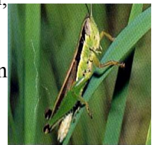
Châu chấu trưởng thành hại lúa

- Châu chấu phá hại quanh năm, thường gây hại nặng trên lúa chiêm xuân cuối vụ, mạ mùa và lúa mùa sớm.