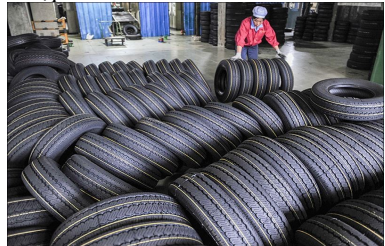
Hình minh họa

Trước thực trạng gian lận thương mại về giá của một số Doanh nghiệp nhập khẩu lốp ô tô từ Trung Quốc trong thời gian qua, Tổng cục Hải quan mới đây đã ban hành công văn yêu cầu các Cục Hải quan tỉnh, thành phố thực hiện các biện pháp nhằm ngăn chặn tình trạng gian lận thương mại qua giả tính thuế và khai sai mã số hàng hóa đối với mặt hàng lốp ô tô nhập khẩu.