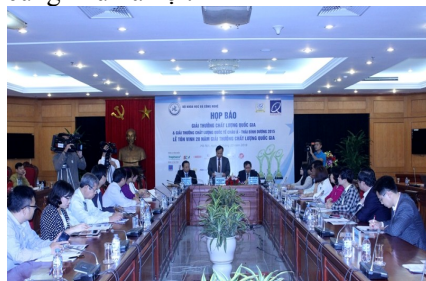
Toàn cảnh buổi họp báo

Việc tôn vinh, khen thưởng về chất lượng là một đòi hỏi khách quan của doanh nghiệp. Đặc biệt, trong thời điểm hiện nay, tiêu chuẩn, chất lượng đã và đang trở thành một trong các yếu tố quan trọng để tạo nên sự phát triển bền vững cho doanh nghiệp cũng như xã hội.