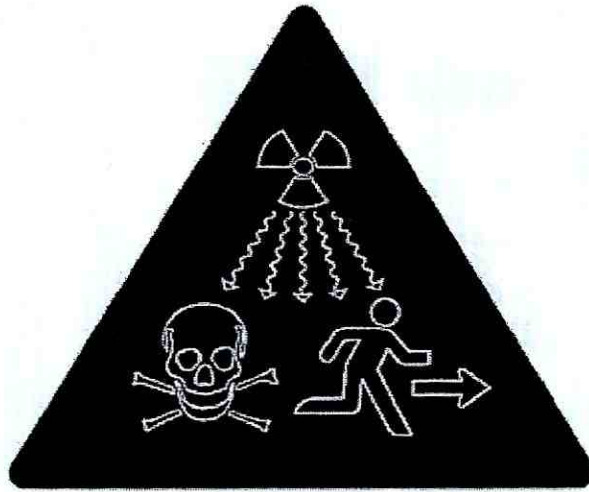
Hình 2: Dấu hiệu cảnh báo bức xạ ion hóa bổ sung sử dụng cho các nguồn phóng xạ thuộc mức an ninh A, B và C

Kích thước, màu sắc của dấu hiệu cảnh báo bức xạ ion hóa bổ sung thực hiện theo Tiêu chuẩn quốc gia TCVN 8663:2011 ISO 21482:2007